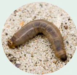
Larve der Wiesenschnake ( Tipula paludosa )

NemaTrident F enthält den natürlich vorkommenden nützlichen entomopathogenen Nematoden Steinernema feltiae für den Einsatz im Sport- und Golfgras und zur Rollgrasproduktion.