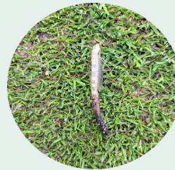
Adult der Kohlschnake ( Tipula oleraceae )